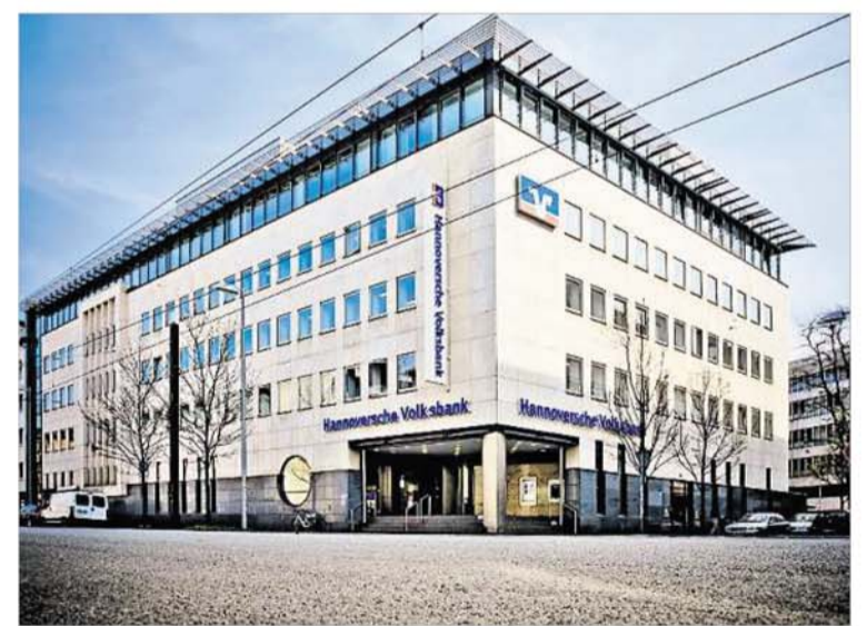
Die Hannoversche Volksbank präsentiert das Pferderennen am 16. Mai in Langenhagen.

Außerdem gibt es ein großes Kinderland mit vielen Attraktionen. Bei der Kinder-tombola und der beliebten Wettnietenaktion locken zudem tolle Gewinne für Groß und Klein. Die kleinen Besucher sind auch zu einem kostenlosen Steckenpferd-Bastelwettbewerb eingeladen. Und zum Pferdesport gibt es natürlich auch Fußball: Beim Torwandschießen können die Teilnehmer ihr Glück versuchen.