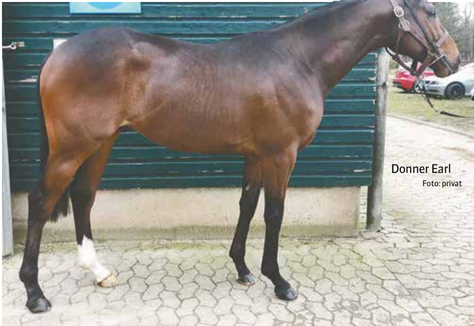
Donner Earl