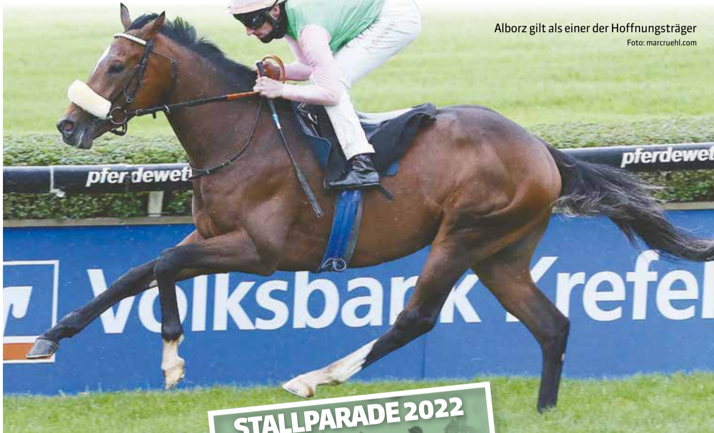
Alborz gilt als einer der Hoffnungsträger